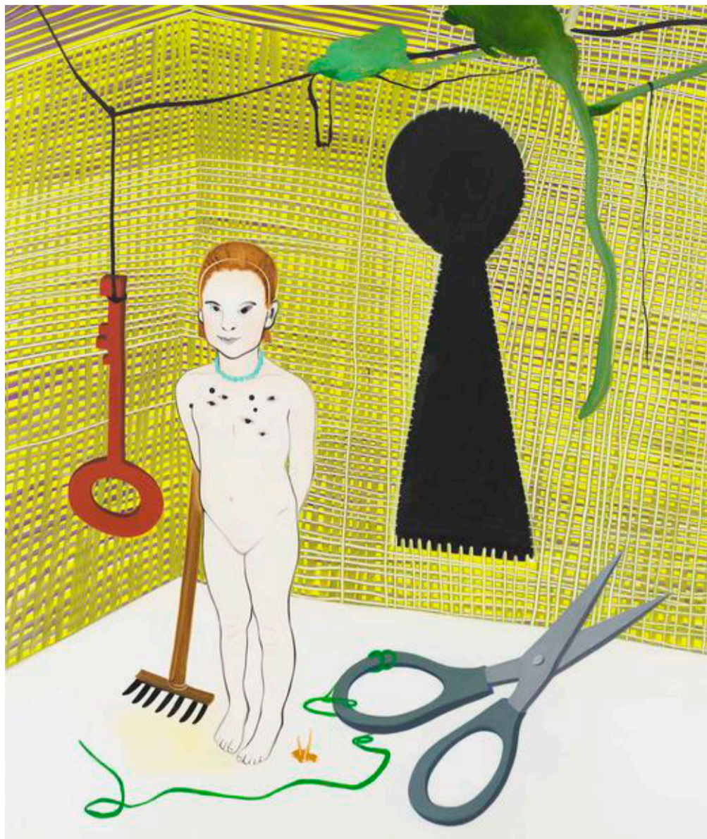
Dette maleri har givet titlen til udstillingen og indeholder Kathrine Ærtebjergs centrale motiver: kroppen, nøglen, nøglehullet, saksen og øjnene: "De tusind gåders sted", 2006, olie på lærred, 170 x 204 cm.